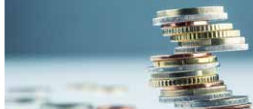
U betaalt gemeentelijke rekening p.3