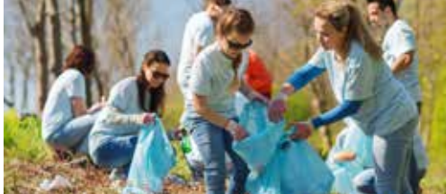
Neem foto's van zwerfvuil en win! p.2