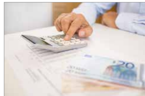
▲ De gemeente schuift de factuur van de slechte gemeentefinanciën door naar u.

Ondertussen werkt onze N-VA-afdeling al volop aan plannen voor een beter bestuur na de verkiezingen van 2018. De vernieuwende voorstellen vinden we niet alleen in eigen kring, maar ook dankzij uw input.