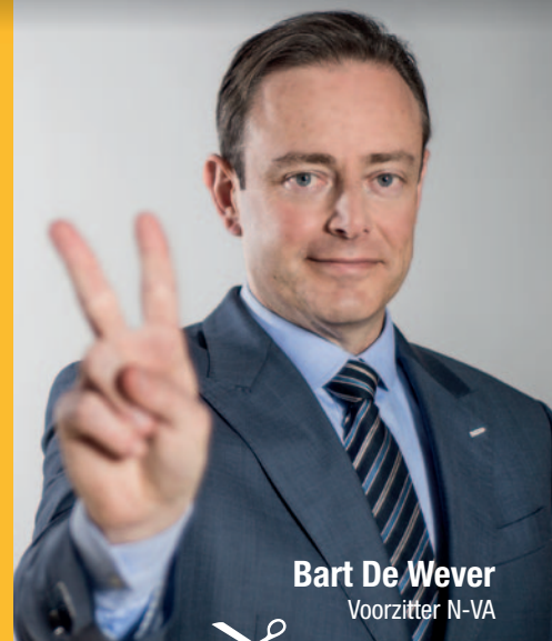
Bart De Wever Voorzitter N-VA