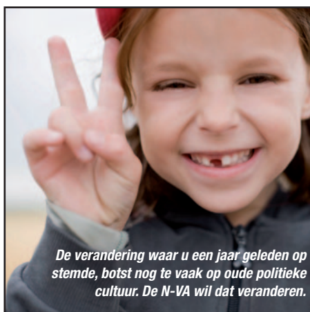
De verandering waar u een jaar geleden op stemde, botst nog te vaak op oude politieke cultuur. De N-VA wil dat veranderen.