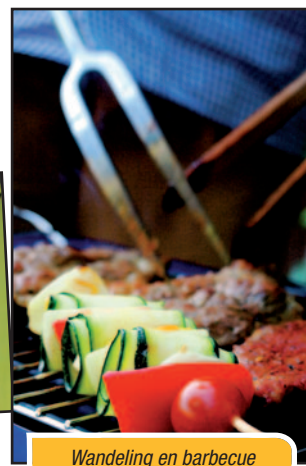
Wandeling en barbecue