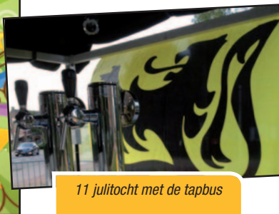
11 julitocht met de tapbus